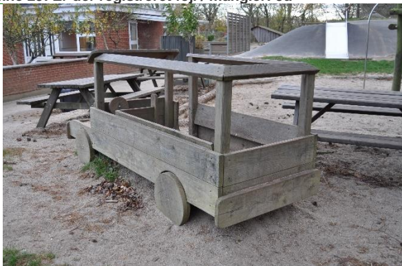
Redskab: Lege bus Årgang: Producent: Nikostine Er redskabet mærket: Ja Emne 31: Er der registreret fejl / mangler: Ja