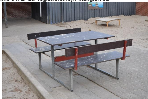
Redskab: Bord bæk sæt

Emne 35: Er der registreret fejl / mangler: Ja