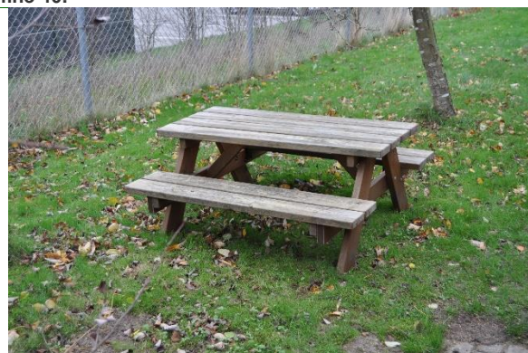
Redskab: Bord bæk sæt