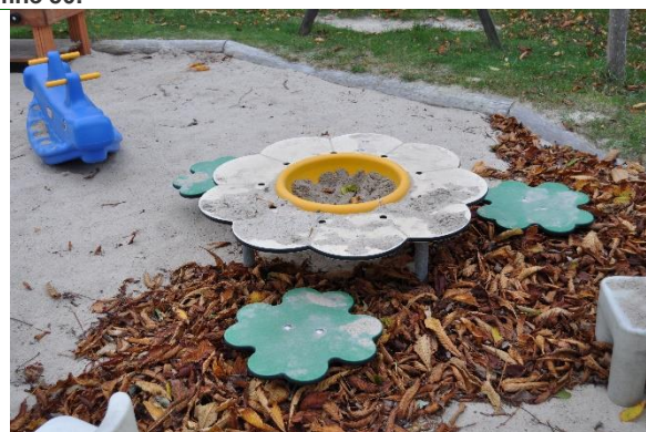
Redskab: legebord Producent: Kompan Er redskabet mærket: Ja

Emne 51: Er der registreret fejl / mangler: Ja