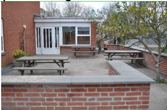
Redskab: Bord bæk sæt