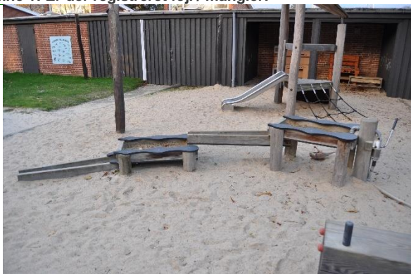
Redskab: Vandleg Producent: Guldborg

Emne 2: Er der registreret fejl / mangler: Nej