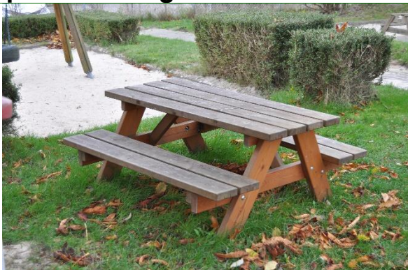
Redskab: Bord bæk sæt