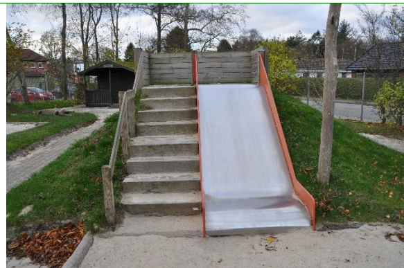
Redskab: Rytsjebane Årgang: 2001 Producent: Egen produktion Er redskabet mærket: Ja Emne 56: Er der registreret fejl / mangler: Nej