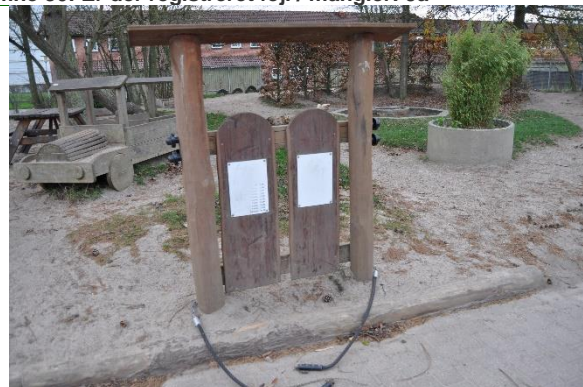
Redskab: Legeredskab Årgang: 2020 Producent: Rudeco Er redskabet mærket: Ja Emne 32: Er der registreret fejl / mangler: Nej