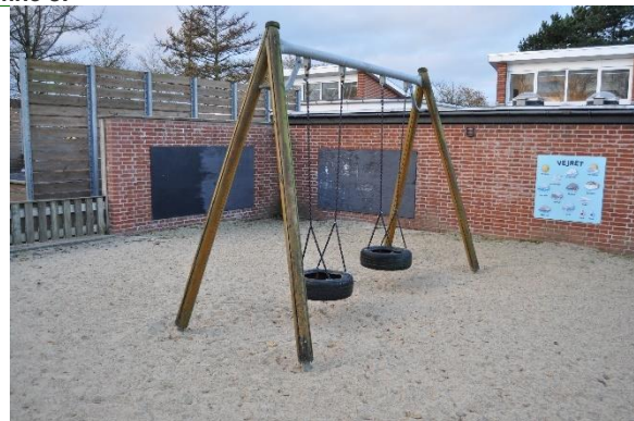
Redskab: Gynger Årgang: Producent: Er redskabet mærket: Nej Emne 10: Er der registreret fejl / mangler: Ja