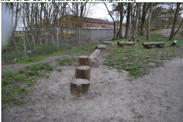
Redskab: Balance sti Årgang: 2018 Producent: JRJ Ribe Er redskabet mærket: Ja Emne 17: Er der registreret fejl / mangler: Nej