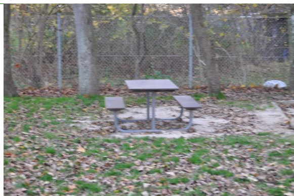
Redskab: Bord bæk sæt