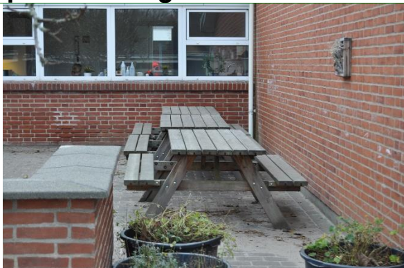
Redskab: Bord bæk sæt