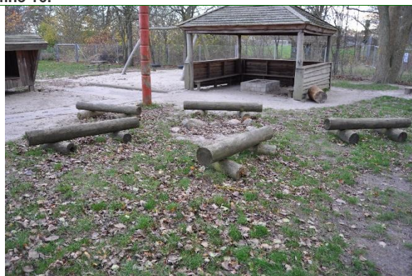
Redskab: Bål plads Ikke omfattet af DS/EN 1176: Emne 18: