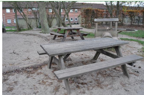
Redskab: Bord bæk sæt