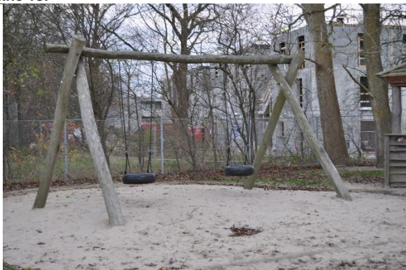
Redskab: Gynger Årgang: 2018 Producent: JRJ Ribe Er redskabet mærket: Ja Emne 15: Er der registreret fejl / mangler: Nej