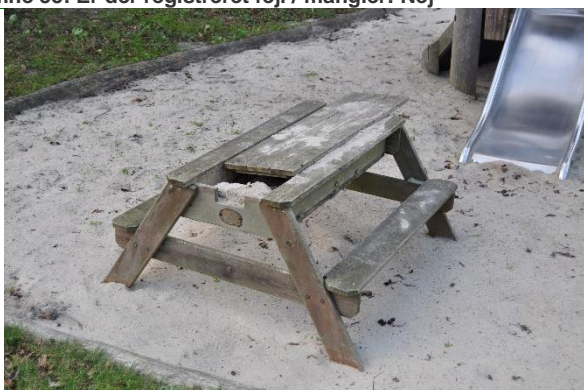
Redskab: legeb Ikke omfattet af DS/EN 1176: Emne 57: