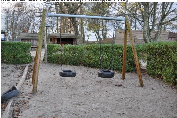
Redskab: Gynger Årgang: Producent: Er redskabet mærket: Nej Emne 11: Er der registreret fejl / mangler: Ja