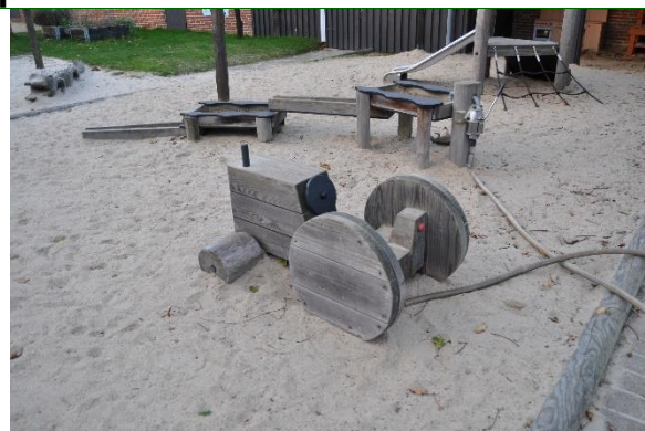
Redskab: Legeredskab Producent: Guldborg

Emne 1: Er der registreret fejl / mangler: