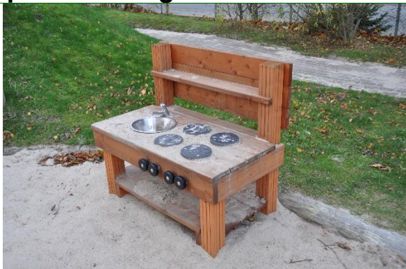
Redskab: legebord Årgang: 2021 Producent: Rudeco Er redskabet mærket: Ja Emne 55: Er der registreret fejl / mangler: Nej