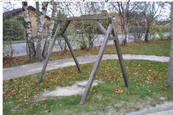
Redskab: Gyng Producent: Egen produktion Er redskabet mærket: Ja

Emne 53: Er der registreret fejl / mangler: Nej