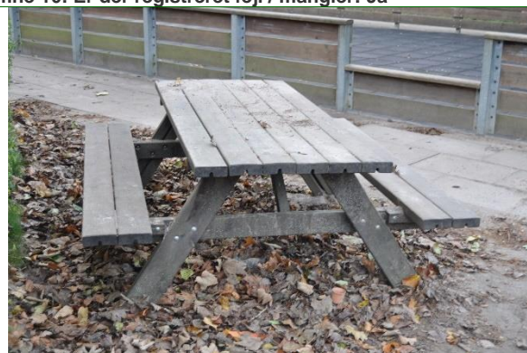
Redskab: Bord bæk sæt Ikke omfattet af DS/EN 1176 Emne 12: