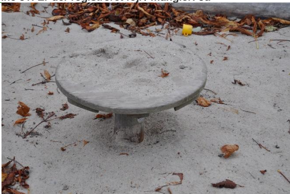
Redskab: legebord Producent: Kompan Er redskabet mærket: Ja

Emne 52: Er der registreret fejl / mangler: Nej