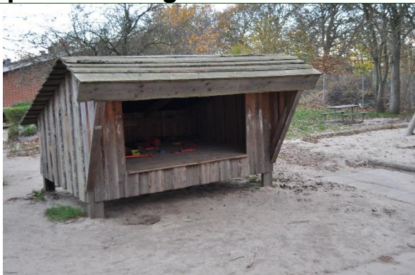
Redskab: Shelter Producent: Tiset Savværk Er redskabet mærket: Ja Emne 19: Er der registreret fejl / mangler: Ja