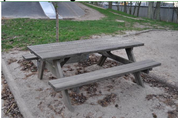
Redskab: Bord bæk sæt