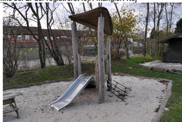
Redskab: Klatretårn m. rutsjebane Årgang: 2016 Producent: Guldgorg Er redskabet mærket: Ja Emne 58: Er der registreret fejl / mangler: Nej