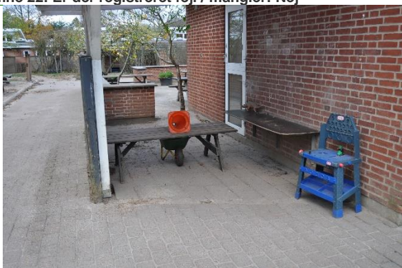
Redskab: Bord bæk sæt Ikke omfattet af DS/EN 1176 Emne 24: