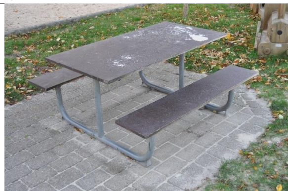
Redskab: Bord bæk sæt