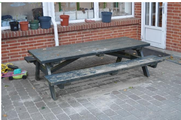
Redskab: Bord bæk sæt