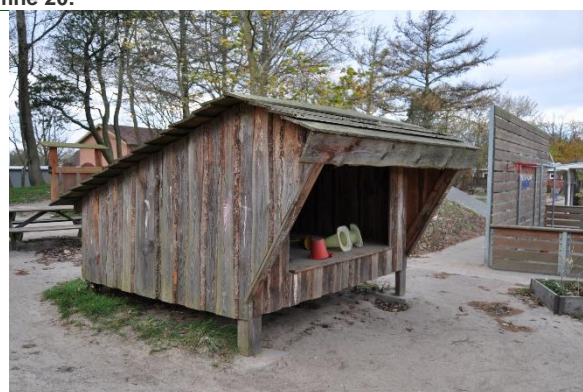
Redskab: Shelter Producent: Tiset Savværk Er redskabet mærket: Ja Emne 23: Er der registreret fejl / mangler: Ja