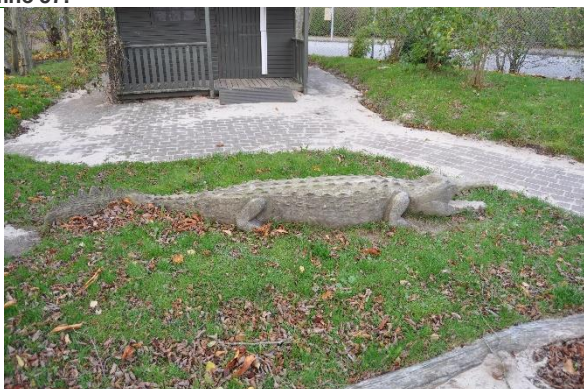
Redskab: Klatredyr Årgang: Producent: Grønagergård savværk Er redskabet mærket: Ja Emne 59: Er der registreret fejl / mangler: Ja