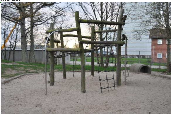
Redskab: Klatreredskab Årgang: 2009 Producent: Egen produktion Er redskabet mærket: Ja Emne 29: Er der registreret fejl / mangler: Ja