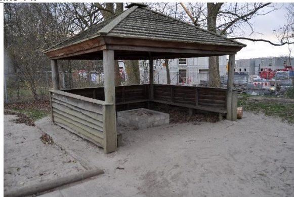
Redskab: Bålhytte Ikke omfattet af DS/EN 1176: Emne 16: