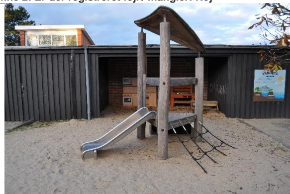
Redskab: Klatretårn m. rutsjebane Årgang: 2018

Emne 3: Er der registreret fejl / mangler: Nej