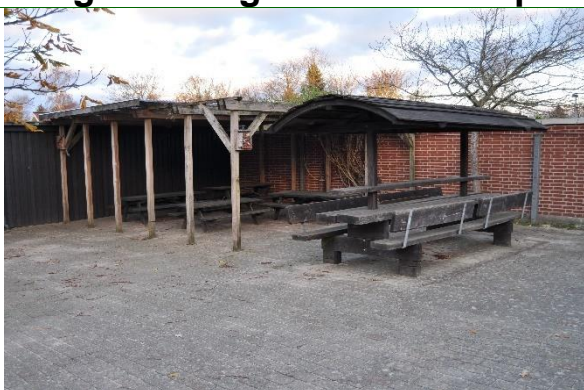
Redskab: Bord bænke sæt