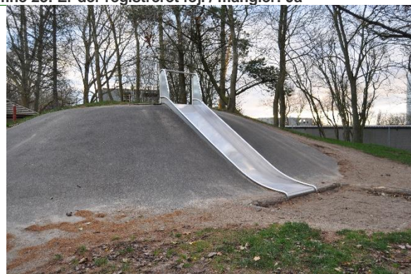
Redskab: Rutsjebane Producent: Er redskabet mærket: Nej Emne 25: Er der registreret fejl / mangler: Ja