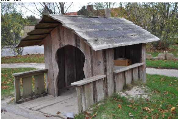
Redskab: Legehus Producent: Bløcher Er redskabet mærket: Ja