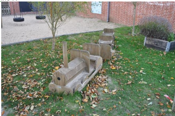
Redskab: Legetog Årgang: 2019 Producent: Nikostine Er redskabet mærket: Ja Emne 9: Er der registreret fejl / mangler: Nej