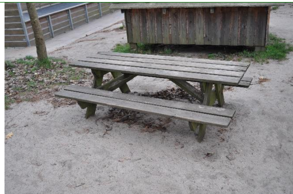
Redskab: Bord bæk sæt